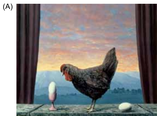
(René Magritte. Variante da tristeza .)

Uma obra representativa do movimento artístico retratado no texto está reproduzida em: