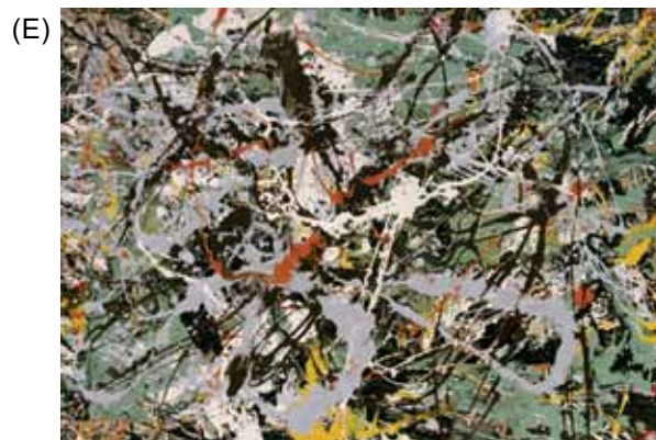
(Jackson Pollock. Sem título .)