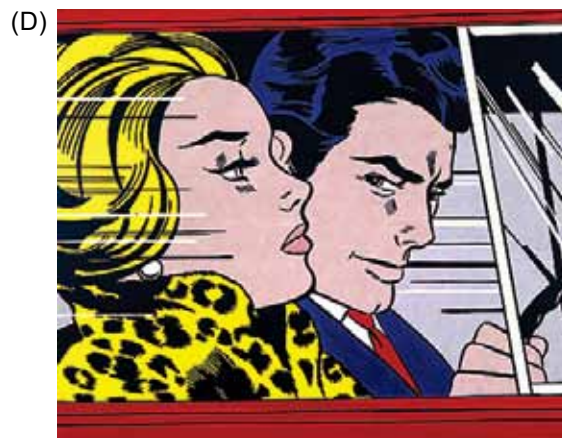
(Roy Lichtenstein. No carro .)