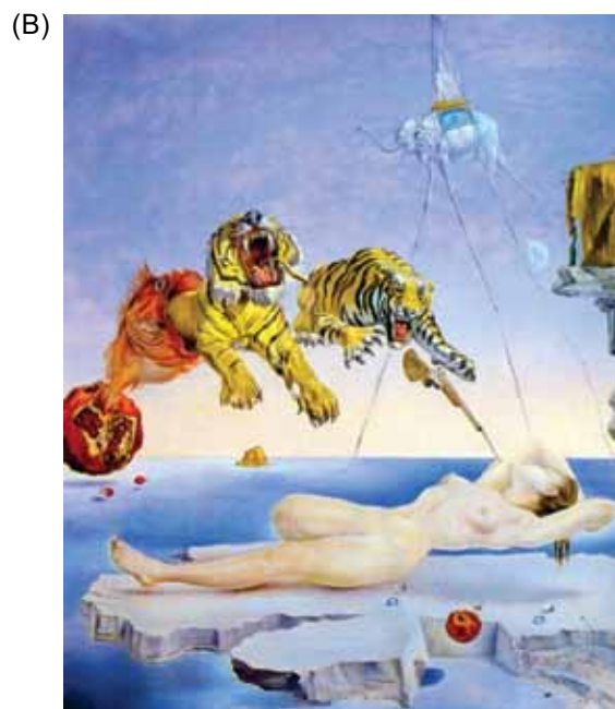
(Salvador Dalí. Sonho causado pelo voo de uma abelha ao redor de uma romã um segundo antes de acordar .)