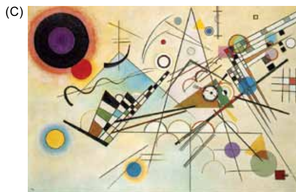
(Wassily Kandinsky. Composição VIII .)